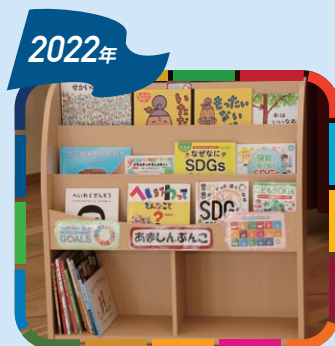
2022年 芦屋市内の 保育所等へ贈呈 SDGs関連絵本および絵本棚