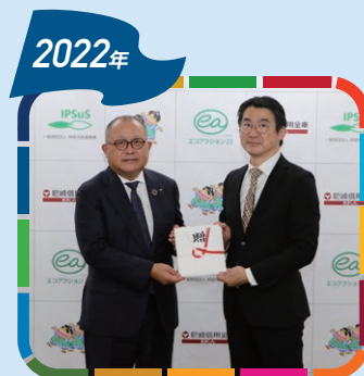
2022年 一般財団法人 持続性推進機構に 寄付