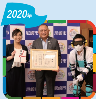
2020年 尼崎市へ贈呈 高齢者疑似体験教材

ご融資総額の0.5%から50万円を拠出し、2020年度以降、毎年地域課題の解決に寄与している団体などに贈呈しました。