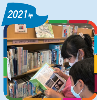
2021年 西宮市へ贈呈 総合百科事典ポプラディア